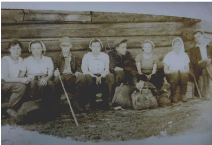
Участники похода на привале, 1961 г.